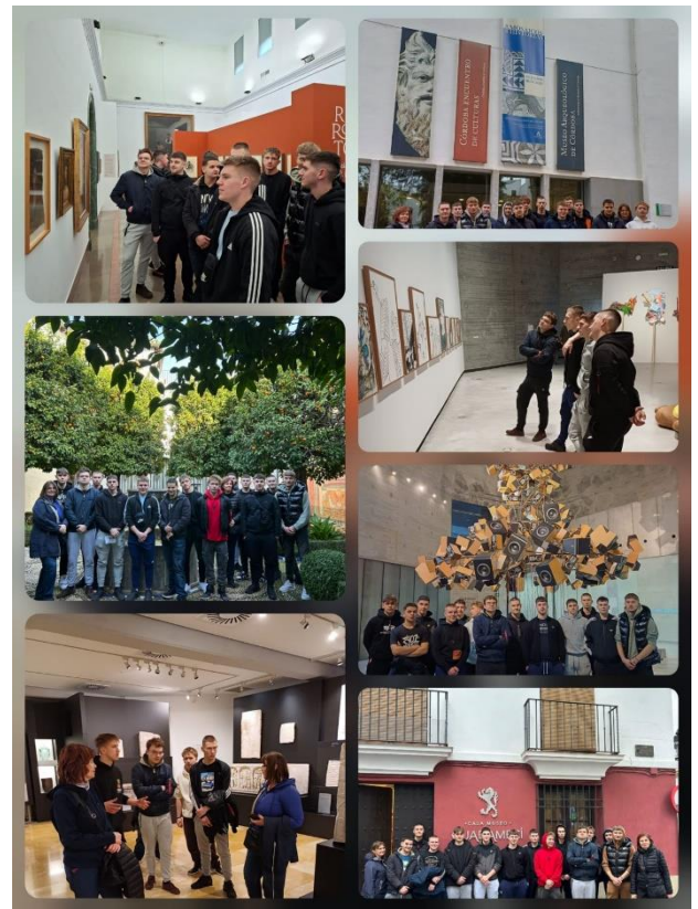
Posjet kulturološkim znamenitostima Cordobe