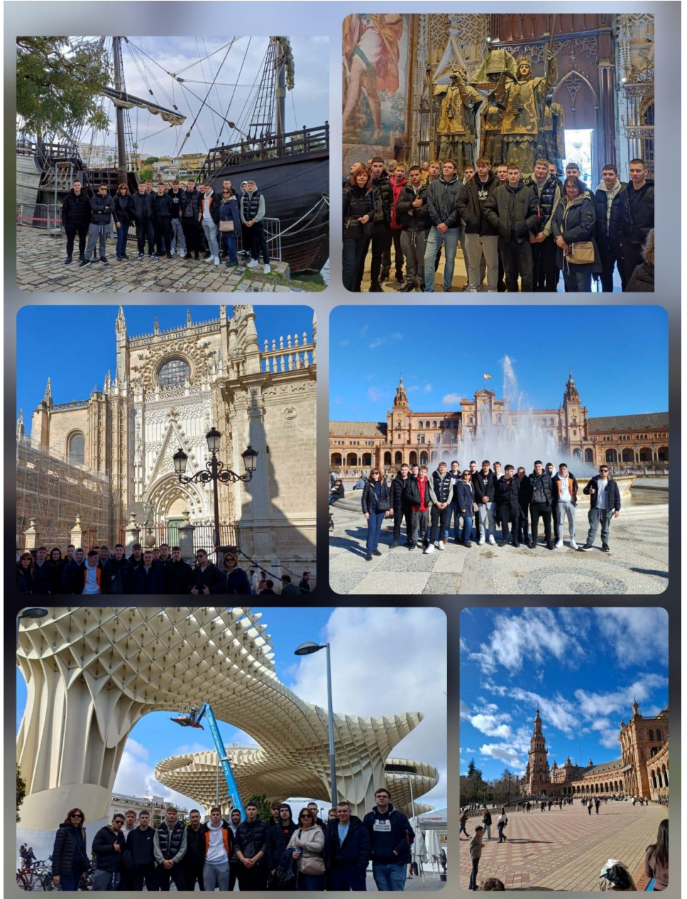
Posjet kulturološkim znamenitostima Seville

U pratnji nastavnica za vikend učenici su posjetili Seville, glavni grad Andaluzije. Posjetili smo Katedralu koja je jedna od najvećih u Europi s čuvenim maurskim zvonikom, pogledom na grad i Kolumbovom grobnicom. Zatim smo prošetaли do Španjolskog trga s velikom vodenom instalacijom, klupama s obojenim keramičkim pločicama i raskošnim paviljonom. Obišli smo i Setas de Sevilla skulpturalnu drvenu strukturu s arheološkim muzejom, šetnicom na krovu i vidikovcem.